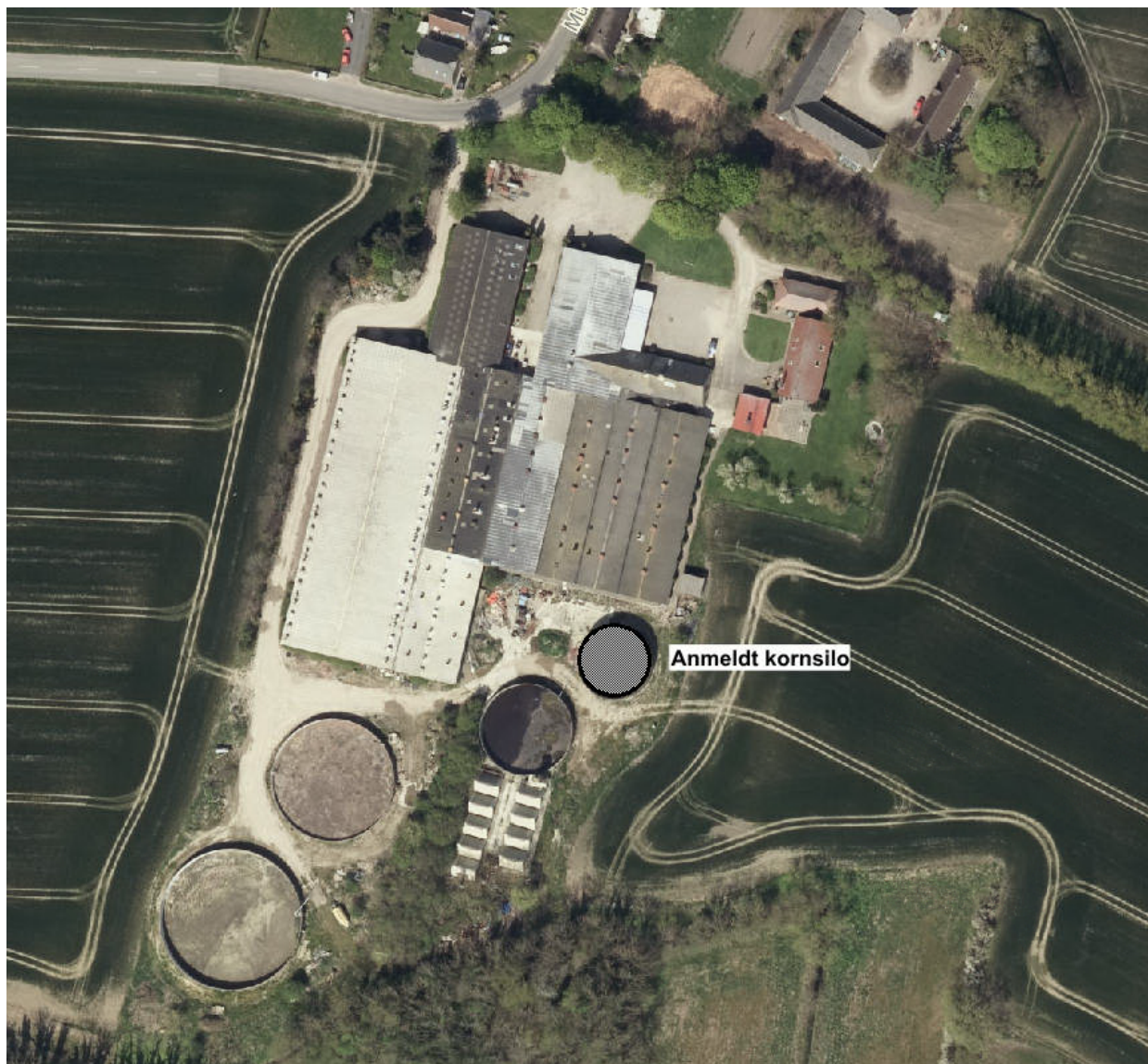
Oversigt over beliggenheden af produktionsanlægget og anmeldt kornsilo på Mullerupvej 43.

Der er ikke knyttet særlige landskabelige beskyttelsesinteresser til det aktuelle landskab omkring Mullerupvej 43. De aktiviteter der normalt knyttes til drift af kornsiloer vurderes ikke at give anledning til en væsentlig påvirkning af miljøet. Det vurderes derfor samlet, at etablering af maskinhallen ikke vil give anledning til en væsentlig negativ påvirkning af miljøet eller landskabet.