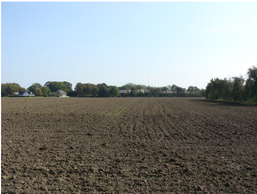
Fotopunkt 1: Mullerupvej 43 set fra Kertemindevej

På baggrund af ovenstående vurderes den anmeldte kornsilo ikke, at give anledning til væsentlig negativ påvirkning af de nærmeste omboende. Betingelsen vurderes at være opfyldt.