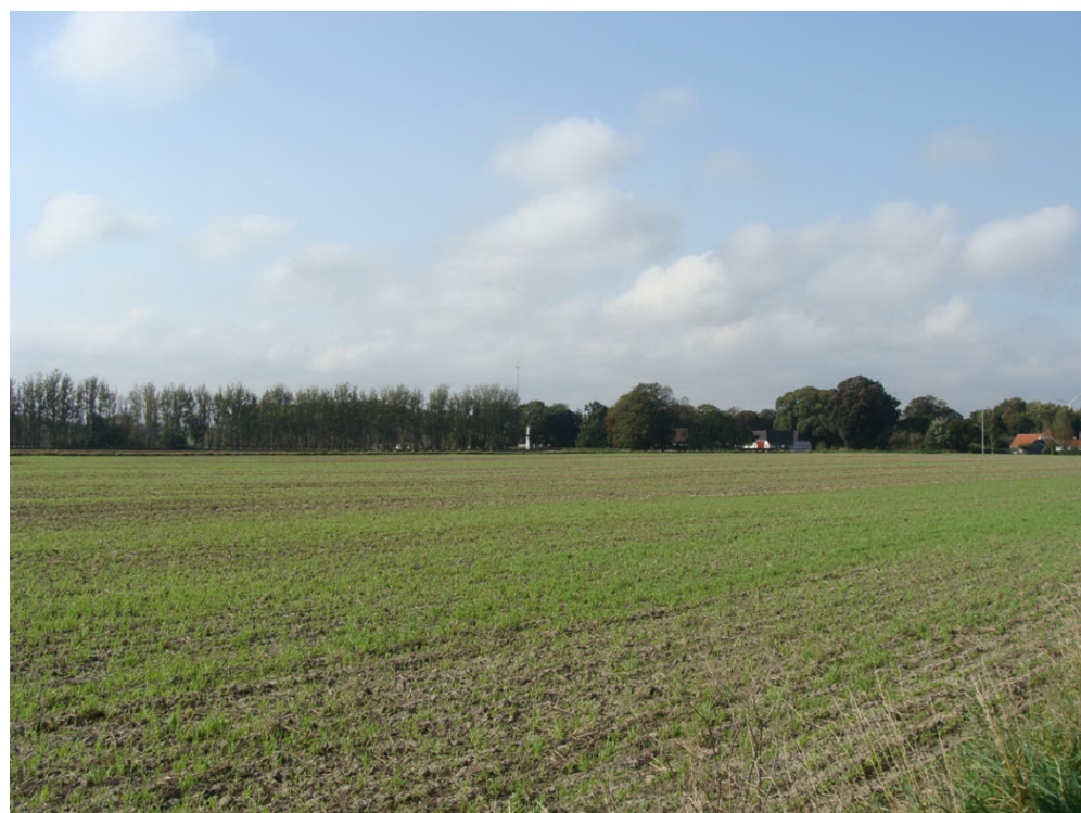
Fotopunkt 3: Mullerupvej 43 set fra Mullerupvej – indkørsel til Mullerup fra øst