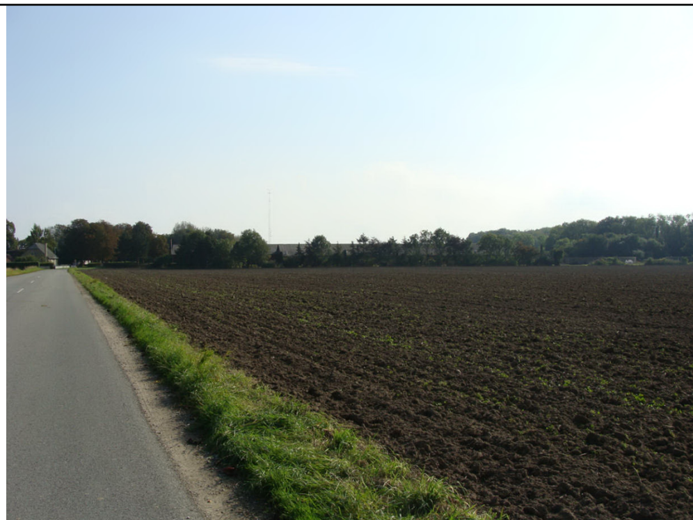
Fotopunkt 2: Mullerupvej 43 set fra Mullerupvej - indkørsel til Mullerup fra vest